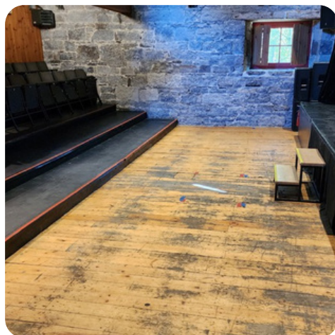
Sans siège (100$)