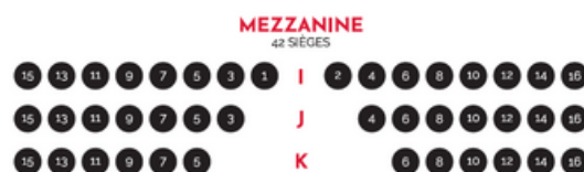
Plan de la salle