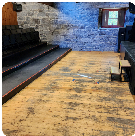
Sans siège (100$)