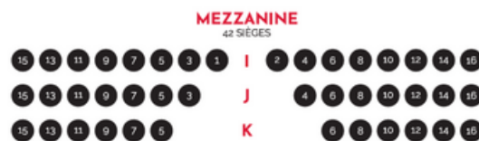
Plan de la salle